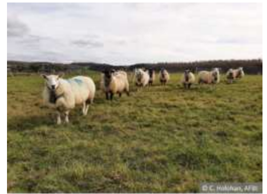
Fig.3: Brebis équipées de colliers virtuels spécifiques aux ovins