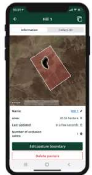
Fig.1: Pâturage virtuel dans une zone de montagne avec une "zone d'exclusion" autour d'un lac d'eau douce