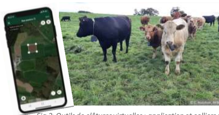
Fig.2: Outils de clôtures virtuelles : application et colliers pour vaches allaitantes et veaux