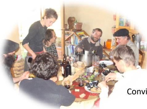
Convivialité constructive des repas partagés

Tarif professionnels 150 €/jour (170 €/jour si prise en charge par le FAFSEA ou autre) Particuliers 70 €/ jour, une réduction sera appliquée en fonction du nombre de jours 10 personnes maximum, la priorité sera donnée aux personnes participant à toutes les journées