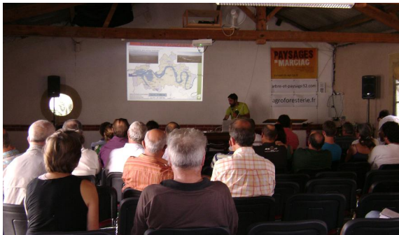
Cours théoriques en salle

en petits groupes pour un meilleur accompagnement et garantir les résultats