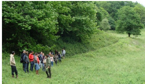
Cours théoriques sur le terrain