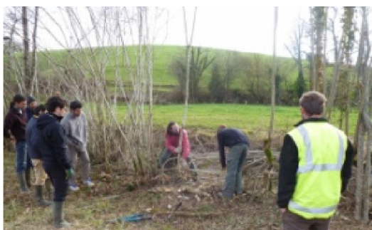
Mise en application par la pratique